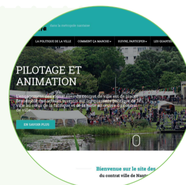
Site Contrat-ville agglonantaise

L'annuaire est consultable sur le site www.contrat-ville-agglonantaise.fr