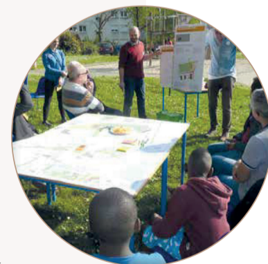
Printemps du projet Nantes Nord

Cela a permis à l'équipe projet et aux élus d'échanger avec plus de 2500 habitants.