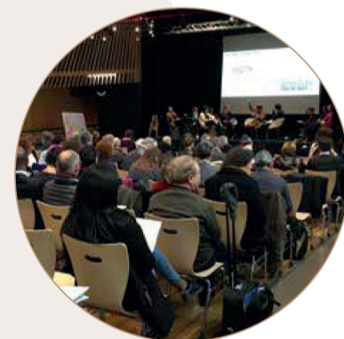
RDV des acteurs, Mars 2017

*ADIE, APIB, ARPEJ de Rezé, Ecopole, Entreprises dans la Cité, Fête le Mur, L'estran Compagnie Giocco Così de Saint-Herblain, la Fal-Ligue de l'enseignement 44, la Luna, Nouvelles voies, Ocean, OPTIMA, PaQ'La Lune, Pulsart, Regart's, Tissé Métisse, Sagesse de l'Image.